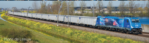
Floris de Leeuw